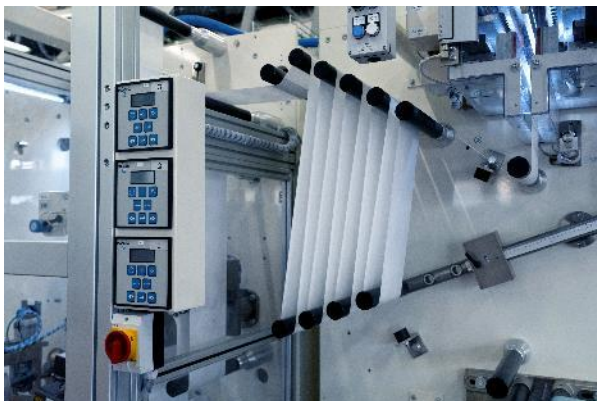
D-TECH-Linie für Atemschutzmasken: System zur Spannungssteuerung